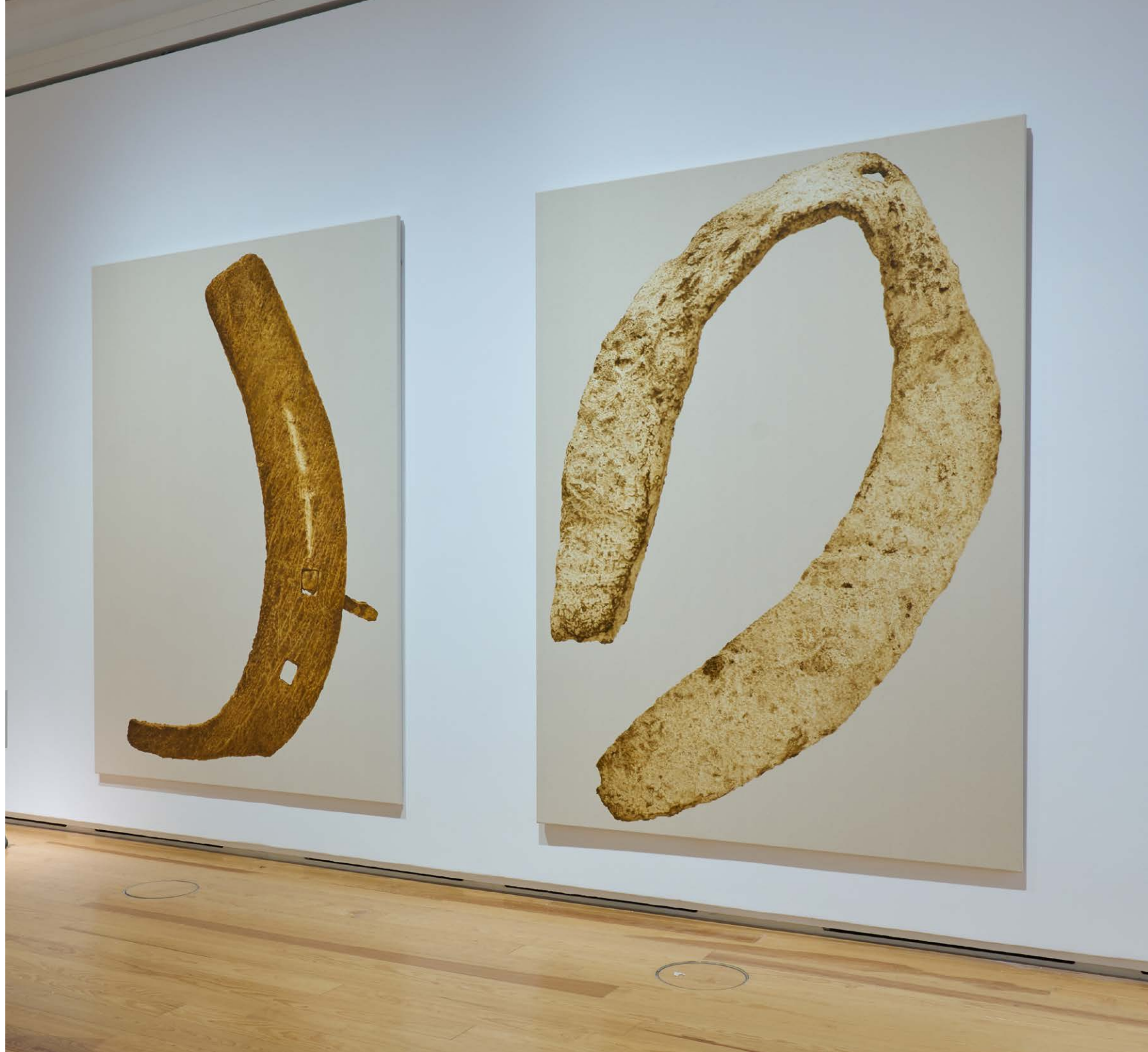
Eisen II & V, 2021 Eisenoxid auf Grundierung, auf Baumwolle 260 cm x 190 cm Ausstellungsansicht, Walk! Schirn Kunsthalle Frankfurt