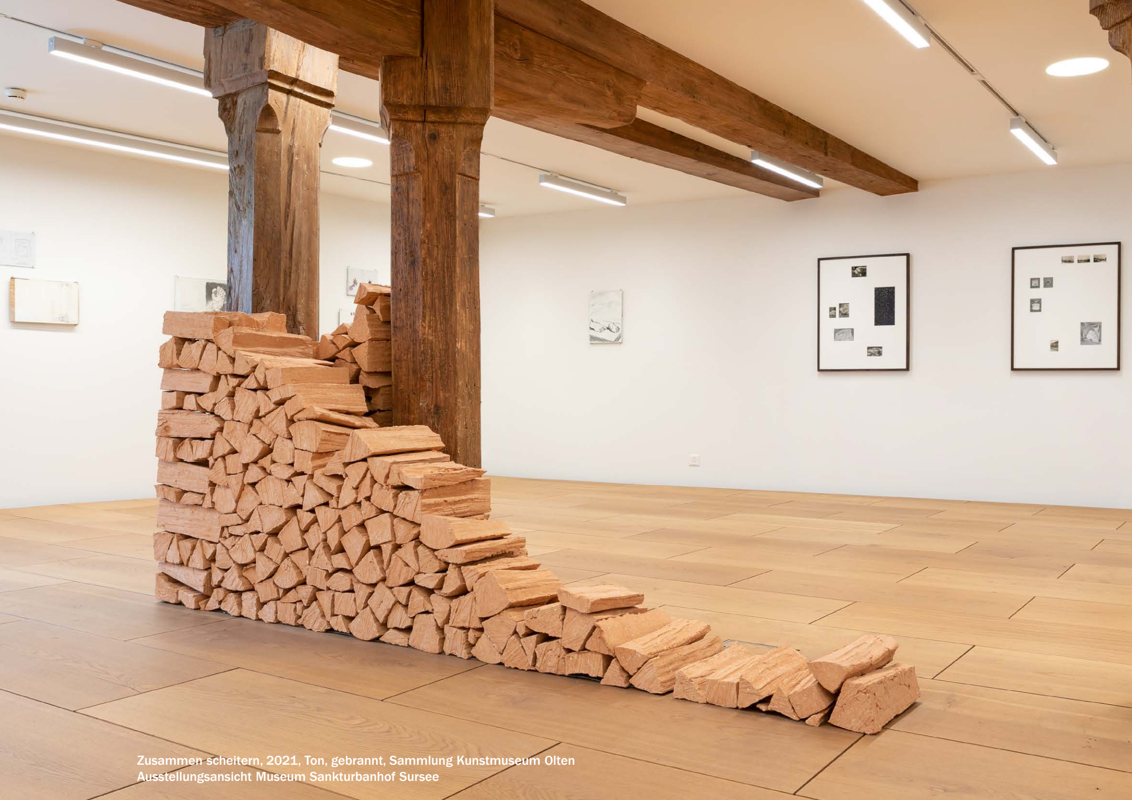
Zusammen scheitern, 2021, Ton, gebrannt, Sammlung Kunstmuseum Olten Ausstellungsansicht Museum Sankturbanhof Sursee