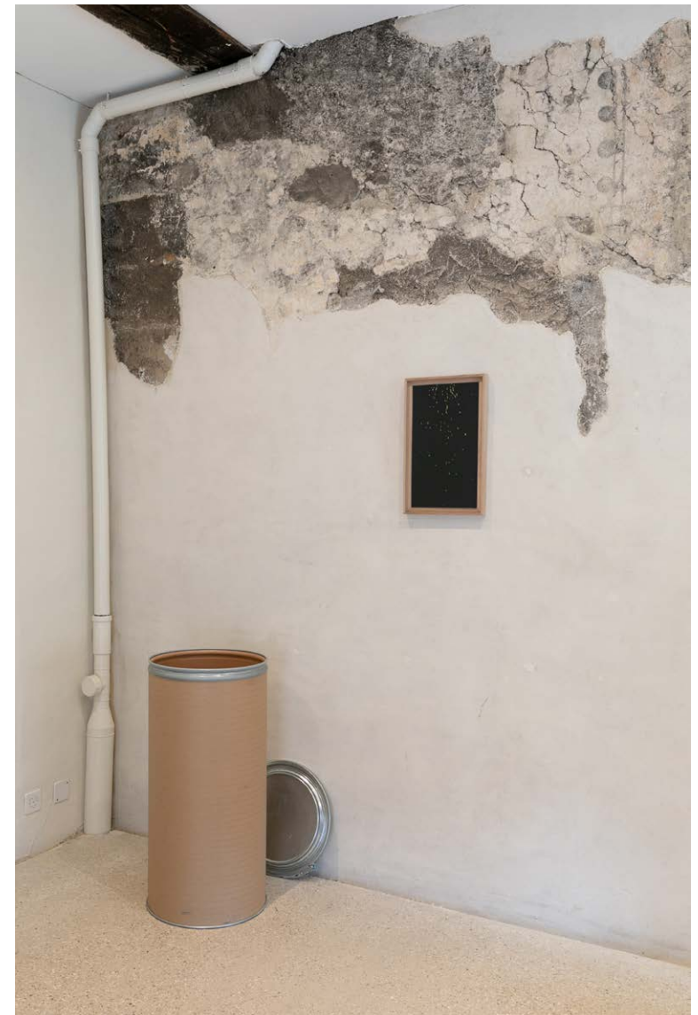
Links: Holz, 2021, Holzkohle, Bienenwachs und Leinöl auf Grundierung, auf Baumwolle Zusammen Scheitern, 2021, rund 500 Objekte, Ton, gebrannt Oben: Funken, 2021, Siebdruck auf schwarzes Papier, Rahmen Lindenblüten, 2020, 100l Lindenblüten, Karton, verzinktes Blech Installationsansicht Kloster Schönthal, Langenbruck