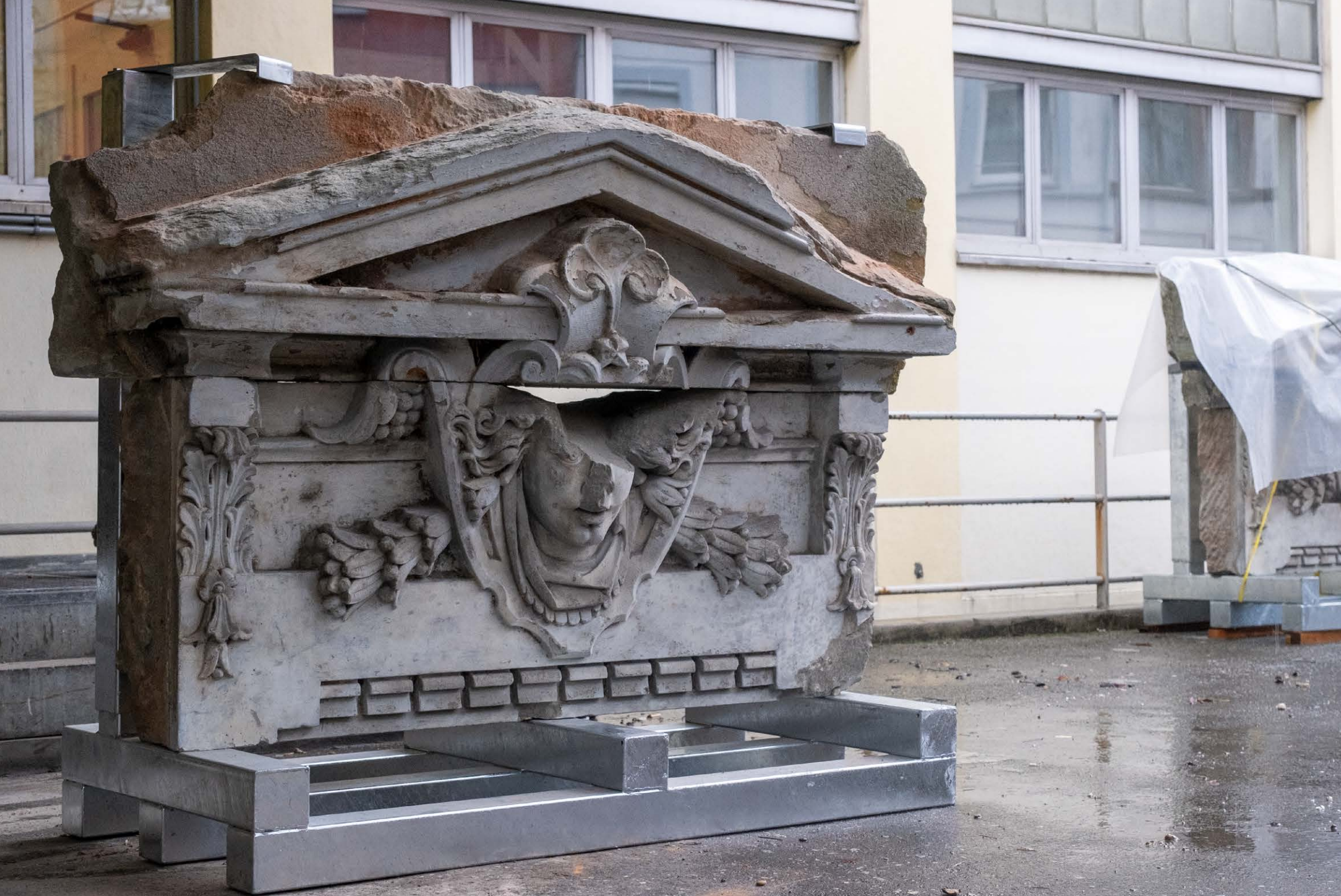
Flora, 2022, Sandstein, feuerverzinktes Eisen, 165 cm x 155 cm x 80 cm, Atellersituation